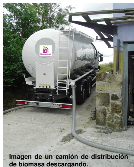
Imagen de un camión de distribución de biomasa descargando.

Existen diversas posibilidades en cuanto a sistemas de suministro, adaptados según las características de los edificios y demanda del usuario. La biomasa se distribuye en los edificios situados en entornos urbanos mediante